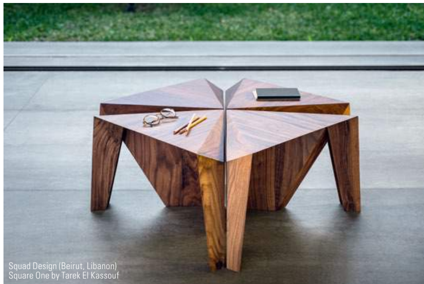
Squad Design (Beirut, Libanon) Square One by Tarek El Kassouf