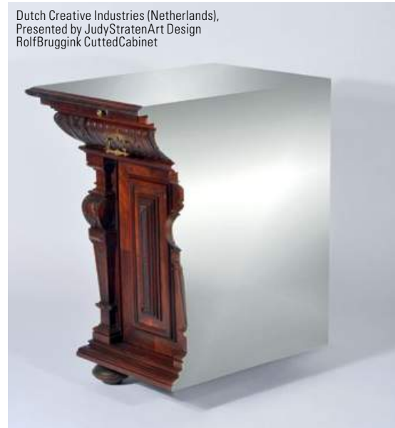
Dutch Creative Industries (Netherlands), Presented by JudyStratenArt Design RolfBruggink CuttedCabinet