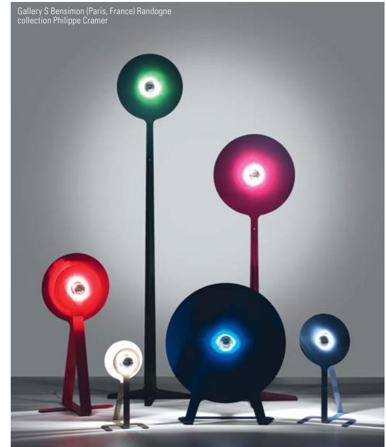
Gallery S Bensimon (Paris, France) Randogne collection Philippe Cramer