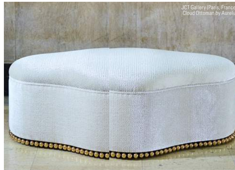
JCT Gallery (Paris, France) Cloud Ottoman by Aurelia

1 Design Days Dubai (DDD) appartient à Art Dubai Group qui en assure la gestion. DDD fait partie de Art Week, initiative de coordination qui rassemble les Arts des EAU et les événements culturels du mois de Mars avec l'objectif de promouvoir les activités culturelles de la région pour les résidents et visiteurs.