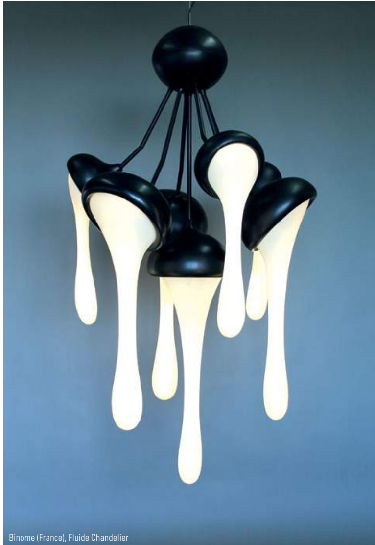
Binome (France), Fluide Chandelier

Design Days Dubai 1 (DDD), the Middle East and South Asia's only collectible design fair returns in Dubai presenting limited edition modern and contemporary design pieces from the world's established and emerging galleries -Carpenters Workshop Gallery (UK/France/