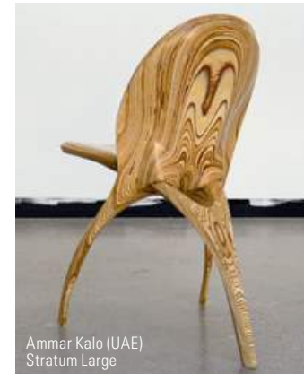
Ammar Kalo (UAE) Stratum Large

(France)- ainsi que les designers de talent, présentent des pièces en éditions limitées modernes et contemporaines. Il y aura également un programme public de projets spéciaux, conférences, ateliers et visites guidées permettant aux visiteurs de découvrir et acquérir les pièces exposées.