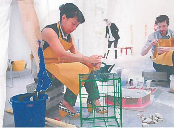
ورش «كنوز المخلفات البلاستيكية»

يقدم «أيام التصميم دبي» مجموعة من ورش العمل التي تهدف إلى تزويد المشاركين مهتمين بالتصميم أو محترفين- بمعارف عملية وتوجيهات من قبل خبراء الصناعة. وستتضمن ورش العمل ما يلي: ورشة عمل عن «عملية التصنيع»، وورشة «تفكيك المكعب» وورشة «التصميم العملي». وأخيراً ورشتا