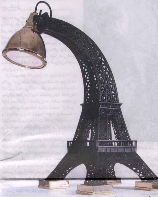
مصباح من وحي برج إيفل