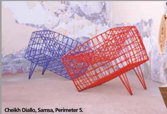
Cheikh Diallo, Samsa, Perimeter 5.