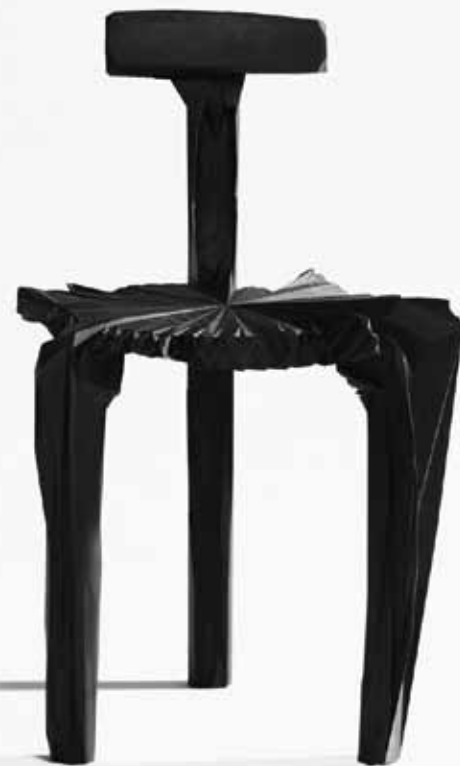
Nóize, Estudio Guto Requena.