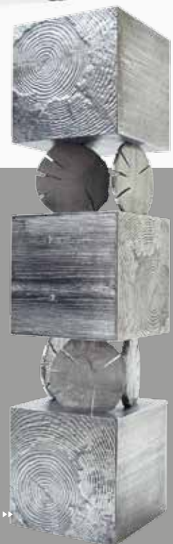
Cabinet Tronchi, Andrea Salvetti. 2021 Gallery.