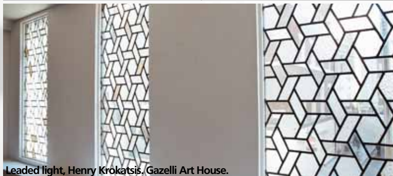
Leaded light, Henry Krokatsis, Gazelli Art House.