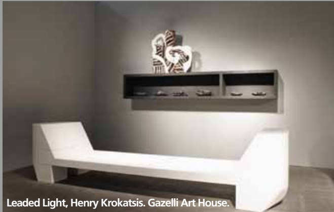
Leaded Light, Henry Krokatsis. Gazelli Art House.