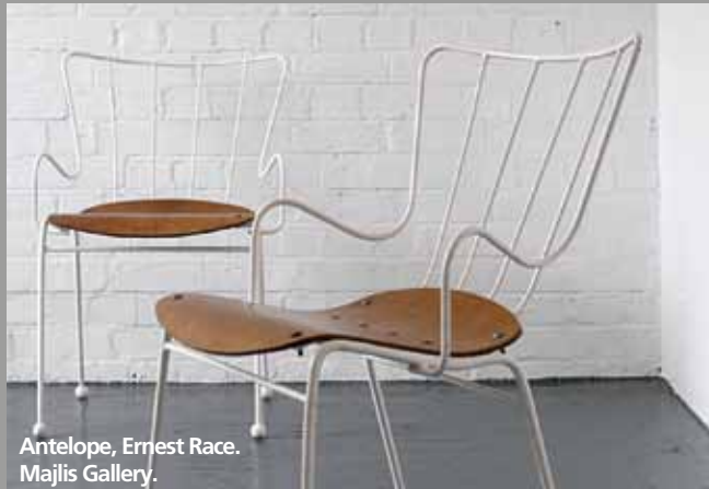
Antelope, Ernest Race. Majlis Gallery.