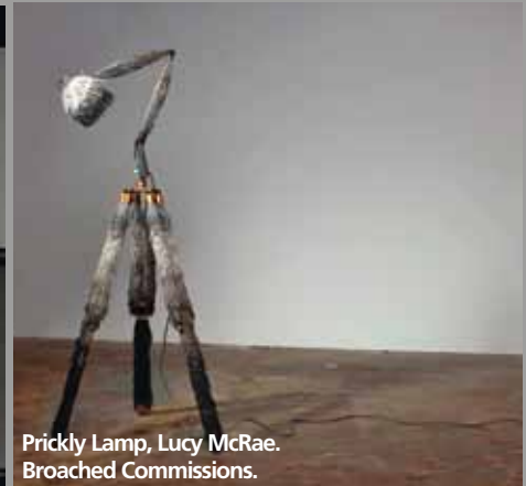
Prickly Lamp, Lucy McRae. Broached Commissions.