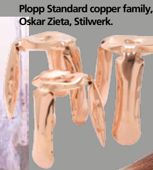
Plopp Standard copper family, Oskar Zieta, Stilwerk.